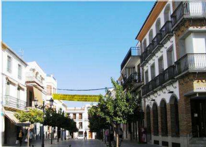
Fotografía 4. Calle peatonal "Blas infante"