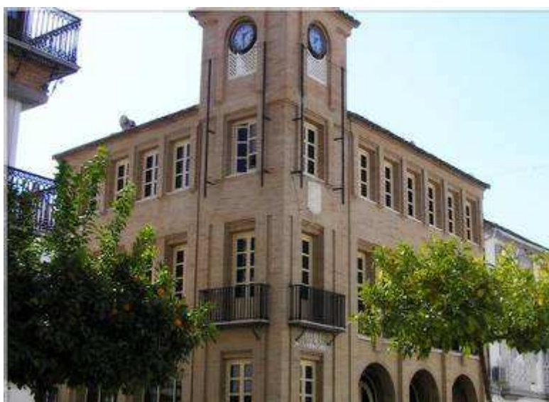
Fotografía 3. Ayuntamiento de Herrera “Esquina Calle Antequera y Avda Constitución”

Las zonas de mayor afluencia ciudadana corresponde a la zona más céntrica del municipio, en ellas encontramos todas las entidades bancarias (6 en total), el Ayuntamiento, farmacias, varios locales comerciales, un centro de salud, una biblioteca municipal, el mercado de abastos y la Oficina de Correos.