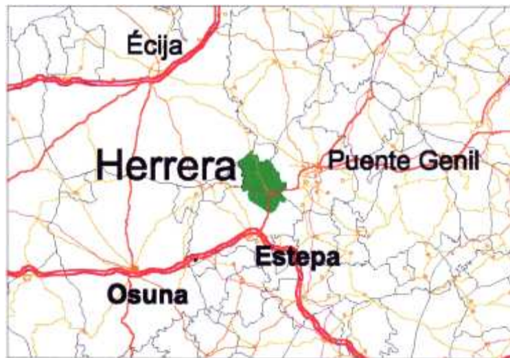
Figura 12. Red Intercomarcal

Una vía perteneciente a este nivel de la red discurre por y atraviesa el término municipal de Herrera, la A-388 . Conecta El Rubio y Marinaleda con Herrera y los pueblos adyacentes al del término de Estepa además de permitir a través de la A-92 la relación con los pueblos cercanos al término de Osuna. Esta comunicación se realiza mediante el enlace de la A-388 con la A-340, conexión que se efectúa tras el paso por el núcleo urbano de Herrera. Atraviesa el término municipal en su parte oriental de Oeste a Este. Su longitud en su discurrir por el término municipal es de 8.5 Kms y el estado de su firme es bueno. Su titular es la Junta de Andalucía.